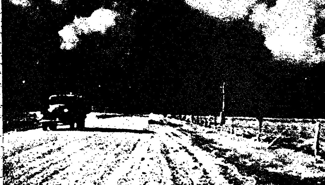
العوامص افريقية تربل الطبقة الرقيقة العليا من التربة وتلحق بالاراضي خسارة فادحة ك يمكن تلحقها لو شجرت تلك الاراضي

في التراب ، وهذه المواد تصل الى التربة اثر تساقط اوراق الاشجار عليها او تكون بقايا لجنذور النباتات ، فتسبب الانفعالات الكيماوية التي تؤدي الى تفكيك الصخور . رايما - اعمال الطفيليات « المكبريا » المستمر ، ويساعد على تفكيك الصخور ويمن تكوين التراب العضوي . هذه التربة التي تحثت على هذه الصور هي التي يزرعها الانسان ، وهي مورد غذائيه اليومي ، فاذا وجدت تربة وجد زرع وجوب وخضروات وفواكه ولينذا يجب اتخاذ جميع الوسائل الفعالة للمحافظة عليها ، فلولاها لما كانت حياة على الارض . وكان الانسان من ازمان سحيقة يسيء استعمال التربة ويسبب بذلك ضياع ثروة ضخمة بتركه مساحات شاسعة من الارض صخرية جرداء والكثير من المؤرخين يعزو فناء بعض الامم الجبري وانتشارها الى سوء العناية بالتربة وضياعها واعظم خطر يهدد بهذا الضياع هو ما نسميه بانجراف التربة بفعل الامطار والسيول ، وخصوصا من سفوح الجبال والواديان ، وبموائل اخرى سنذكرها الان . ومعرفة اسباب الانجراف والعوامل المؤدية اليه معرفة جيدة تساعدنا على توقيها والاحتراز منها ومقاومتها . فاذا لم نتكمن من ذلك تماما ، فلا اقل من ان نجعل الانجراف ضمن حدود مقبولة تجعل التراب المنجر عن تفكك الصخور . وانجراف التربة نوعان . يحدث الاول عادة من حمل المياه الجارية التراب عن وجه الارض ، وهذه الخسارة يخطف مقدارها باختلاف التضاريس مع توالي السنين . ولو نرؤنا ان مياه السيول حملت معها واحدا في المائة من التراب سنويا فان الهكتار الواحد من الارض يخسر مالا يقل عن 20 - 30 طنا . وهذا كثير . ولذلك يجب اتخاذ الاحتياطات لوقف هذه الخسارة . وللمحافظة على التربة ومنع انجرافها طرق مختلفة منها :